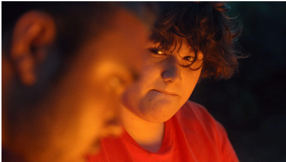
›Big Boys‹