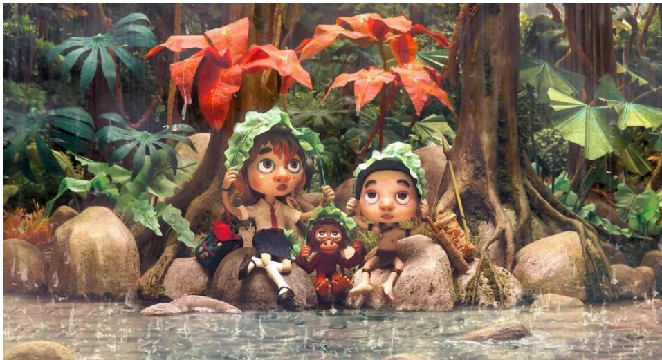
›Savages‹

Animationsfilmers Claude Barras. Ein Film, der nicht nur durch seine wunderbaren Puppenanimationen berührt, sondern auch für eines der wichtigsten Themen unserer Zeit einsetzt: den Erhalt unserer Wälder und den Schutz von Lebensräumen. Um den Wald und allerlei anderes herrlich winterlich Verschneites geht es auch in den fünf Kurzgeschichten aus dem liebevollen Zeichentrickfilm › Weihnachten der Tiere ‹ für die kleinsten Festivalbesucher*innen ab drei Jahren. Hoch her geht es auch in › Flow ‹ des lettischen Regisseurs Gints Zilbalodis. Der Animationsfilm erzählt auf phantastische Weise von der Flucht einer kleinen, einsamen Katze vor einer plötzlich hereinbrechenden Flut. Zuflucht findet sie mit anderen Tieren auf einem dahintreibenden Boot, wo alle trotz ihrer Unterschiede lernen müssen, miteinander auszukommen. Ein mitreißendes Abenteuer.